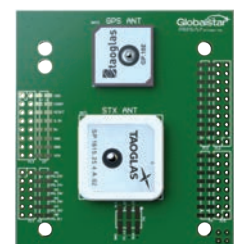
Placa da Antena