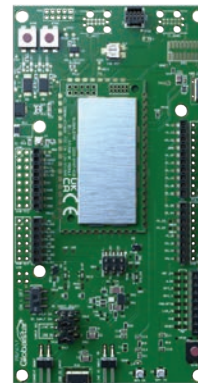
Placa de Desenvolvimento